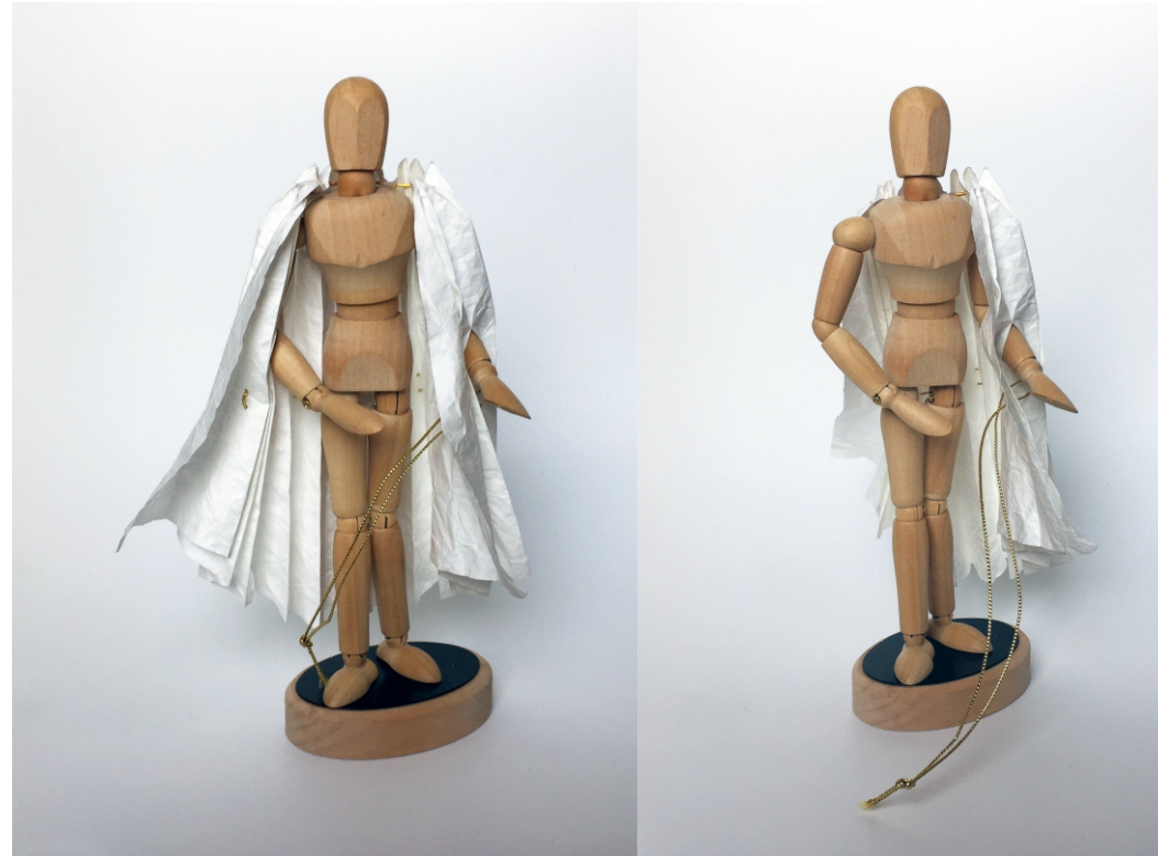
Fechamento da Pelerine / Closing the Pelerine

Design for Emergency Semeando ideias / Seed ideas