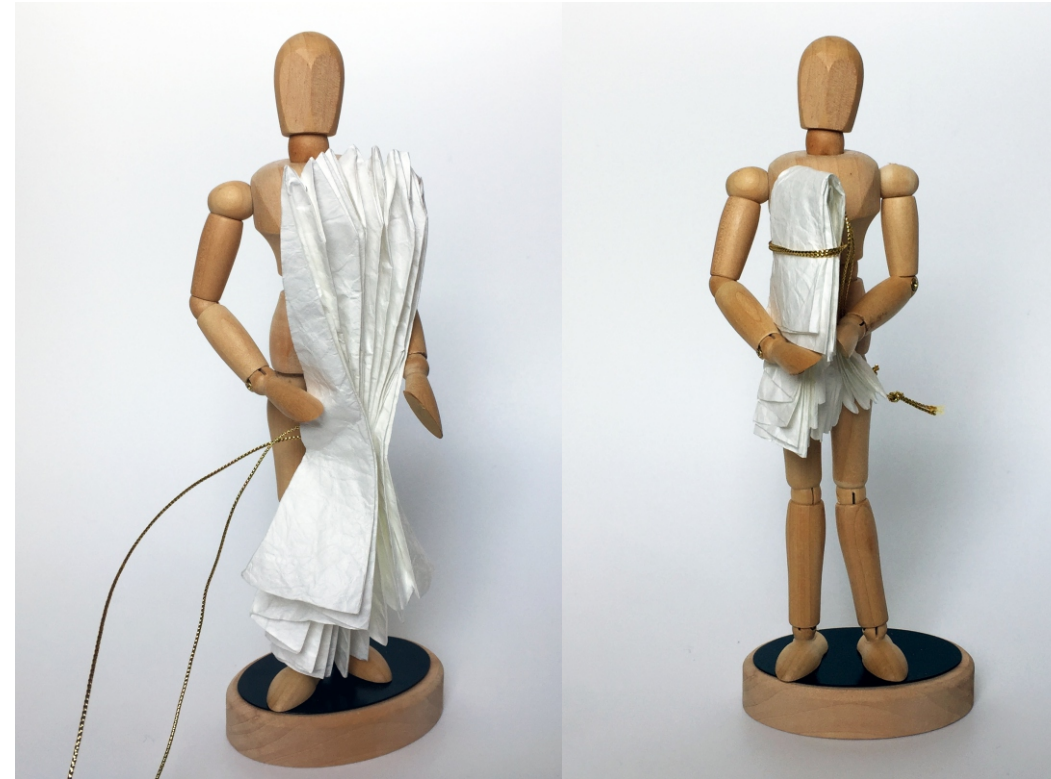
Fechamento da Pelerine / Closing the Pelerine